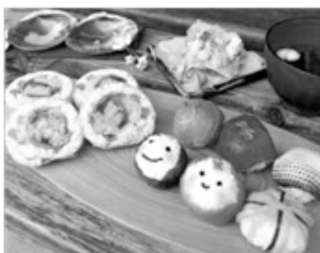
みたけ華ずしと手鞠ずし

県内中山道126.5kmと17の宿場を舞台にした歩いて楽しむ岐阜の旅プログラム。今回は「華と酒」をテーマに、みたけ華ずし作り体験やおすすめの地酒を堪能できるプログラムなど、この季節ならではの体験が楽しめます。