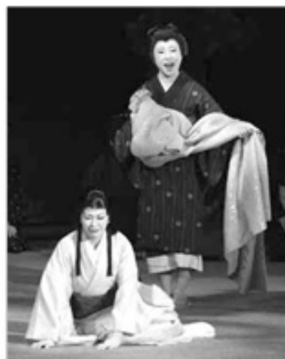
昨年度の公演の様子

県教育文化財団では、県内各地の歴史や文化を題材にした創作オペラを開催しています。今年は、初演から20年をむかえるため、20周年記念特別公演として再演を望む声が多かった人気作品「椿屋敷」、「狐の嫁入り」、「西忍池」を上演します。