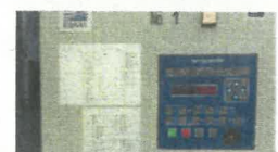
環境制御盤の導入