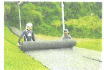
茶の被覆作業の実施