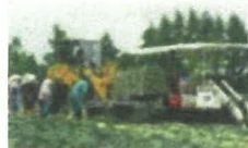
機械化体系の導入