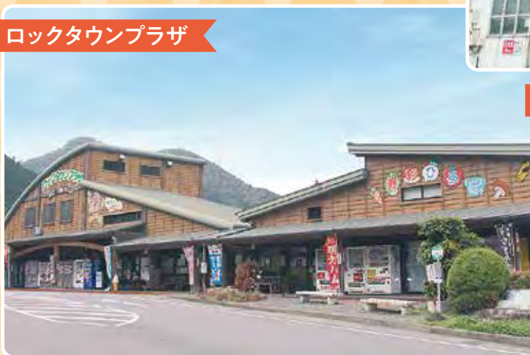
ロックタウンプラザ