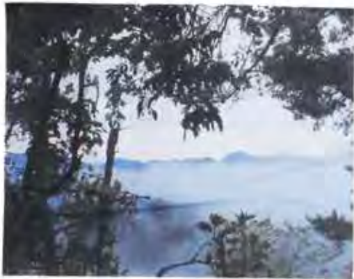
標高 599.0 m 山頂まで約1時間の山