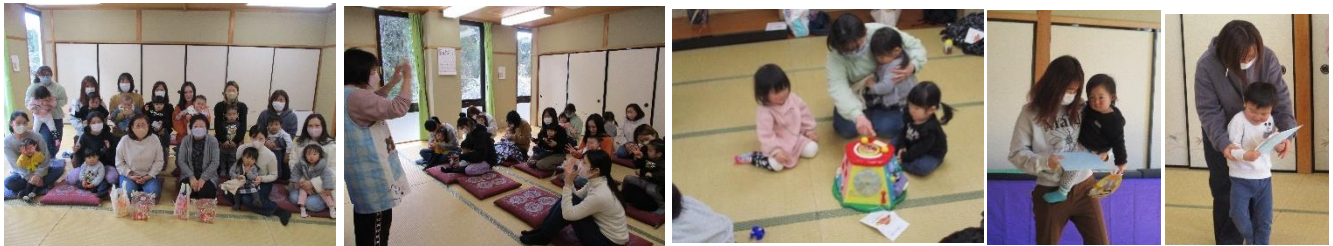
ボランティアさんと 手あそび楽しいね みんなで一緒にあそぼ！ 卒業おめでとう！！

3月に卒業りんごくらぶを行いました。4月からは保育園に入園されたり、ひとつ上のりんごくらぶになるお子さんたちが素敵なスタートを迎えられる事を心から祈っております。また、お世話になった託児ボランティアさんに感謝の気持ちを込めたお花のプレゼントをしました。かわりばんこカフェでは、ママたちの話は尽きませんでしたね。待っている子どもたちの託児もありがとうございました。1年間、ありがとうございました。