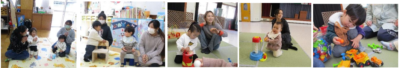
手あそび「ぱちぱち」「ぼくも座ろ～」 「ぱくぱく食べてね」「ボール大好き」「車に荷物をのせよ」

令和5年度最後の園庭開放を行いました。色々なあそびに興味を持ち、あそびができた時には「ニッコリ」と可愛くほほえんだり、うまくいかなかった時は泣いてしまった時もありました。自分で工夫をしてあそぶ姿もありました。子どもはあそびを通して成長をしていきますね。