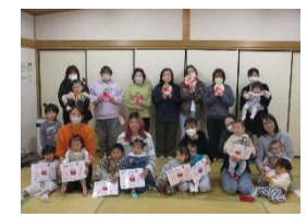
赤りんご・青りんご・黄りんご 卒業おめでとう！