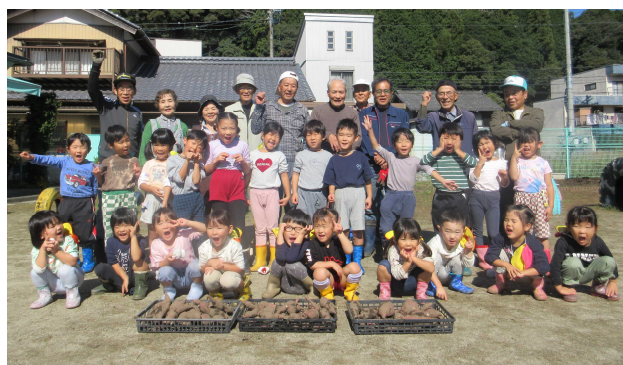
福寿会の方とのいもほり！楽しかったね！