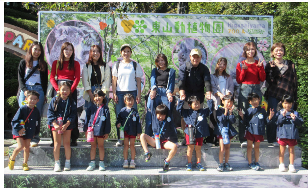
親子遠足で動物園を楽しんできたよ★