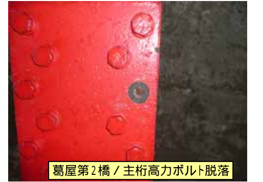
葛屋第2橋 / 主桁高力ボルト脱落