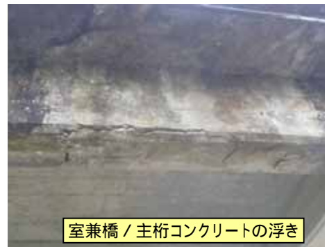
室兼橋 / 主桁コンクリートの浮き