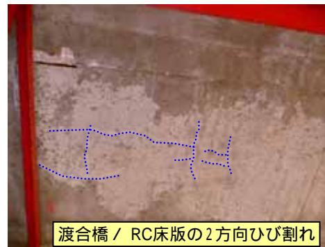
渡合橋 / RC床版の2方向ひび割れ