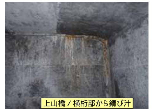
上山橋 / 横桁部から錆び汁