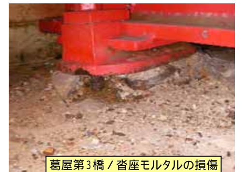
葛屋第3橋 / 脊座モルタルの損傷