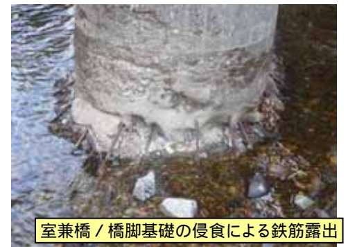
室兼橋 / 橋脚基礎の侵食による鉄筋露出