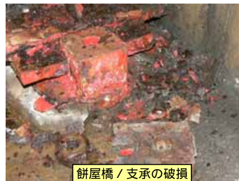
餅屋橋 / 支承の破損