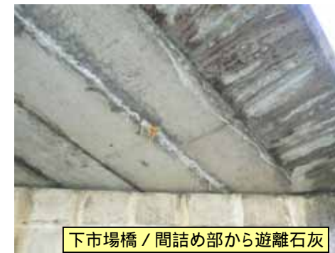
下市場橋 / 間詰め部から遊離石灰