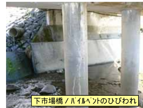
下市場橋 / パイルベントのひびわれ