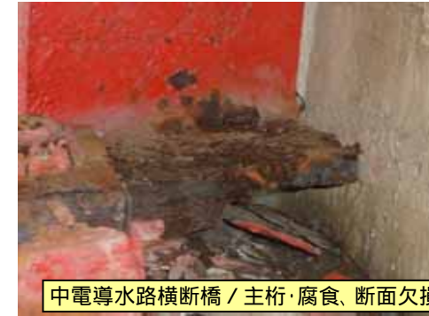
中電導水路横断橋 / 主桁・腐食、断面欠損