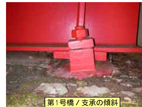
第1号橋 / 支承の傾斜